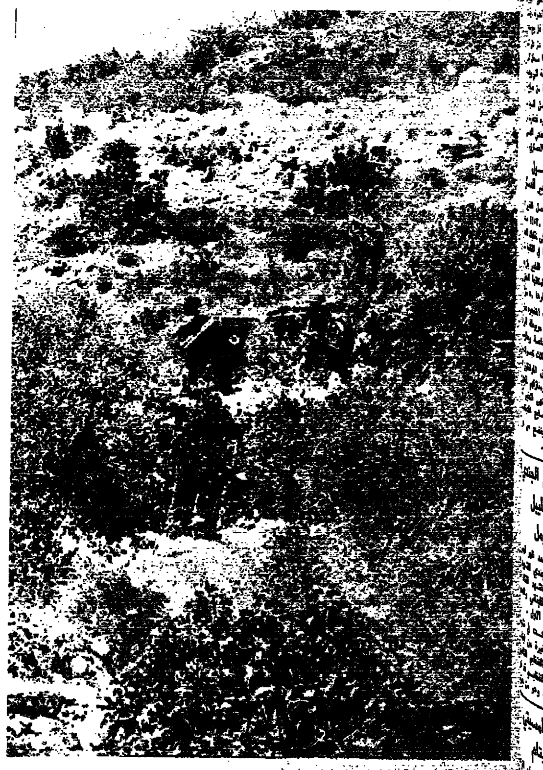
■ جنود اسرائيليون يحملون جثثهم بعد قتلهم أثناء الانسحاب من البلدة

الصور التي غرقت « الانوار » بنشرها امس لجنود العدو الاسرائيلي وهم ينسحبون من « عين الشب » حليين قتلاهم وجرحاهم ، يعتبر اول صور من نوعها تلتقط داخل الاراضي اللبنانية . ويروي نزيه تقوي مراسل « الانوار » في صيدا الذي التقط هذه الصور : وصلت الى بلدة « عين الشب » التي كانت معرضة للقصف صباح امس الاول ، وكانت الاشتباكات لا تزال مستمرة ضد القوات الاسرائيلية المتسللة الى البلدة . ويضيف : وقد تركزت في احد الابناك المظلمة خارج البلدة ، وسكنت بواسطة الضصة الكثير من سجلات لقطات لجموعه من جنود العدو وهم ينسحبون من « عين الشب » حاملة القنابل والجرحى الاسرائيليين على حالات خاصة . ويقول : وقد ابعد الاسرائيليون قتلاهم وجرحاهم الى خارج البلدة حيث حضرت طائرات الطيوس « وقامت بنقلهم الى داخل فلسطين المحتلة .